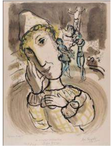
Lithographie de Marc Chagall