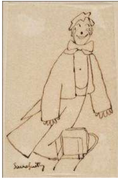
Encre sur calque de Sacha Guitry - ©Jean Bernard