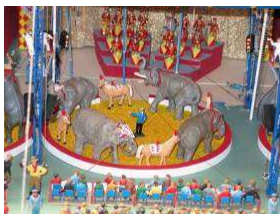
Le Coliseum , maquette de 6.2m x 2.6 m réalisée par Hubert Tièche